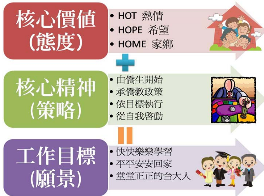
(圖三) 僑生精實要素關聯圖

本組同仁經歷「精實之旅」淬煉，形成一個學習型組織，也孕育出以核心價值為發展重心的工作習慣和態度，並結合核心精神：承僑教政策、由僑生開始、依目標執行和從自我啟動等四項策略，建構各項活動及業務，在這些精神和原則之下，為僑生服務，以期達到僑生的各項需求及「快快樂樂學習、平平安安回家、作一個堂堂正正的台大人」的工作目標（見圖三）。